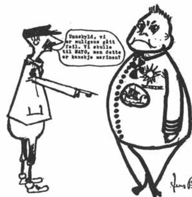
Arne Naess på NATO, tegnet av Jens Bjørneboe.