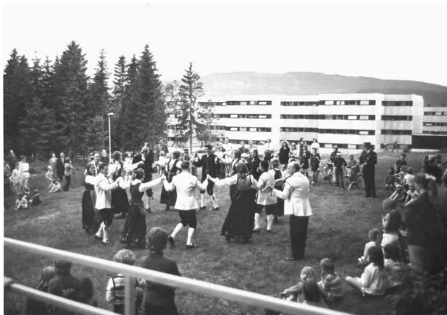
Leikaring på Rykkinn 1972 (Bjørnebærestien i bakgrunnen).

forfatter (Nikolaj Frobenius), musiker (Bård Torgersen) eller komiker (Harald Eia) for at det skal være bra nok? På samme måte som kulturens fravær får skylda for elendigheten på Rykkinn, framstår disse kulturelle uttrykkene som det eneste verdifulle med Rykkinn.